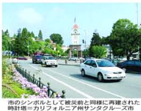
市のシンボルとして被災前と同様に再建された時計塔=カリフォルニア州サンタクルース市

カリフォルニア州サンディエゴに生まれ、全米でタクルース市はアメリカにも有数の快活な街とされ、西海岸に位置する、人口も約50万人のメッカとも知られ、地方都市だ。一年のうち、約300日ばかりが快晴で、近郊には山や森が広がり、クルース郡の郡庁所在地