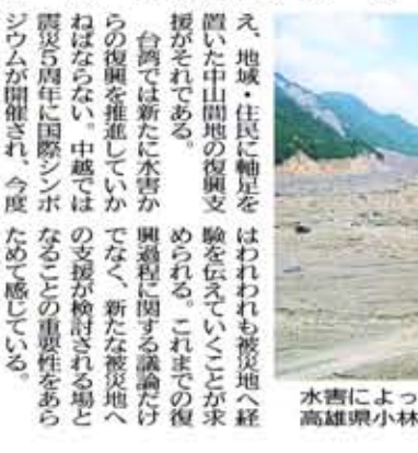
水害によって跡形もなくなった高雄小林村の被災地

1999年9月21日に発生した台湾大地震(震源地は発生地から集集大地震、921大地震とも呼ばれる)からちょうど10年。この間、復興は着実に進んでいる。一方、新たな災害も発生して、復興には厳しい道のりがある。大きな被害を受けたのは、台湾中部の震源地周辺の農村部。過疎や高齢化も進行しており、復興は当初から困難が予想された。また先住民(台湾では「原住民族」と呼ばれる)の復興も、大きな課題となっている。復興には、集落の復興、再生の支援、職が各地に広がることにも注目が集まっている。