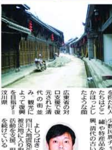
四川省の対口支援を受けた北川県。より支援してきた北川県、さらを得ない。人々の会話を聞くと、被災者の話の端々には、希望の光が目にうつる。土地の価値の問題で調整、多くは住宅再建を終え、落ち着きつつある。そんな中、被災地では、少数民族、チベット族の制を待たれた人々も少なくない。復興を進める上では、少数民族の意見も取り入れる必要がある。東の豊かな省、西の貧しい省が、西の貧しい省を支援する。このシステムは、近年の中国で始まった。このシステムは、近年の中国で始まった。このシステムは、近年の中国で始まった。