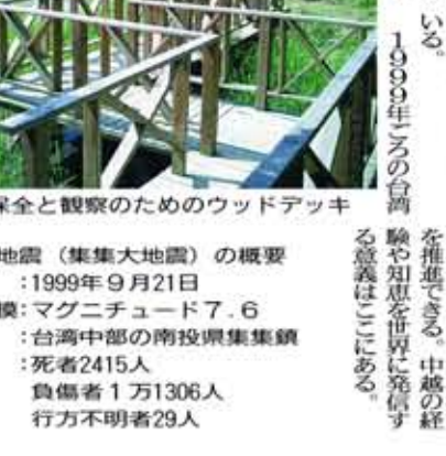
湿原の保全と観察のためのウッドデッキ

台湾大地震。1999年9月21日に発生した台湾大地震(震源地は発生地から集集大地震、921大地震とも呼ばれる)からちょうど10年。この間、復興は着実に進んでいる。一方、新たな災害も発生して、復興には、集落の復興、再生の支援、職が各地に広がることにも注目が集まっている。